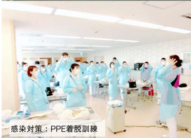
感染対策：PPE着脱訓練