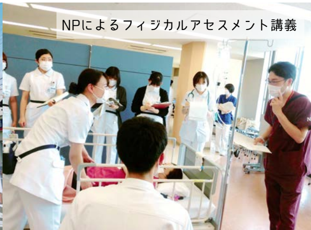
NPによるフィジカルアセスメント講義