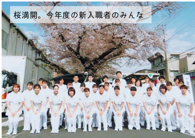
桜満開。今年度の新入職者のみんな